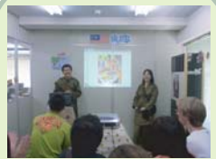
International day (马来西亚)