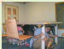
防灾体验 (地震体验等)