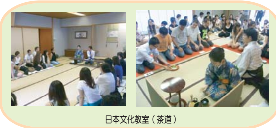
日本文化教室 (茶道)