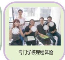
専門学校课程体验